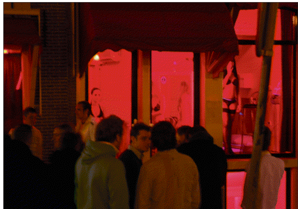
Een stiekeme foto van de 'ramen' op de Wallen.